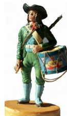
Tambour de la grande Armée