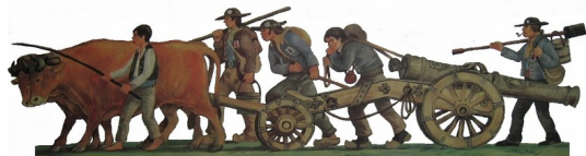
Canon Marie Jeanne et son équipage